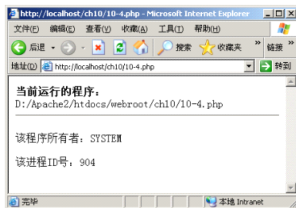
获取程序的所有者和进程号